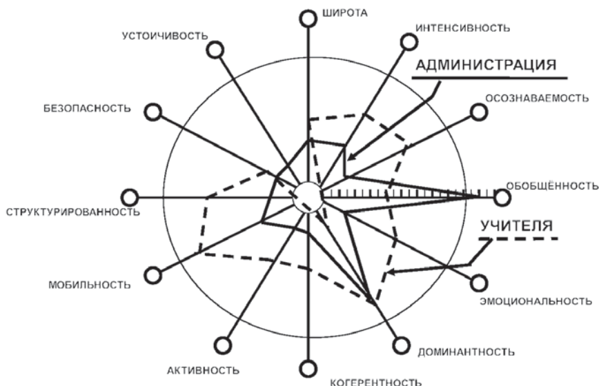
Рис. 5. Оценка параметров образовательной среды педагогами и вновь назначенной администрацией в условиях включения школы в качестве «структурного подразделения» в образовательный комплекс

администрация в основном оценивает параметры школьной среды на низком уровне, в то время как оценки учителей остаются на среднем уровне, кроме оценки параметра «устойчивости», который в этом случае получает отрицательное значение, что совершенно понятно, поскольку данной школы больше не существует как с юридической, так и с административной точек зрения (см. рис. 5).