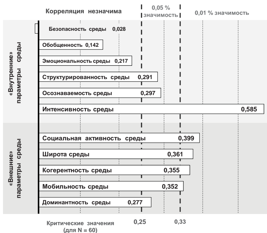
Рис. 3. Результаты корреляционного анализа учебных достижений обучающихся и характеристик школьной среды методом Ч. Спирмена

всего, за счет концентрированности образовательных влияний и возможностей («интенсивности среды»), а также за счет «внешних» факторов, обусловленных взаимодействием школы с социальным окружением: направленности школы на взаимодействие со своим социальным окружением («социальная активность среды»), умения использовать образовательный потенциал этого окружения («широта среды»), адекватности образовательной программы школы социальным запросам («когерентность среды»), способности