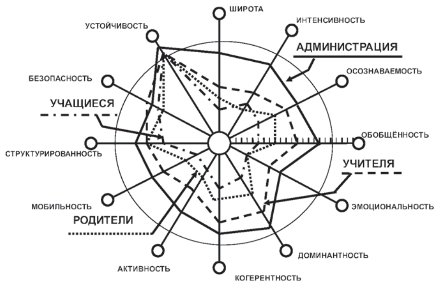
Рис. 4. Оценка параметров образовательной среды различными категориями членов образовательного сообщества («эффект матрешки»)

«экспертных оценок» учащихся в большинстве случаев не превышают уровень «ниже среднего», а часто находятся на «низком» уровне. Характерно, что показатели восприятия школьной среды родителями, как правило, располагаются между показателями педагогов и учащихся, т.е. в диапазоне «среднего» и «ниже среднего» уровней (рис. 4).