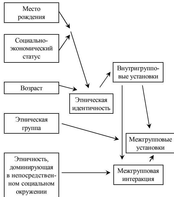
Каузальная модель межгрупповых взаимодействий 6

На установки по отношению к аутгруппе влияют главным образом два фактора: установки по отношению к ингруппе и контакты с другими группами. Установки по отно-