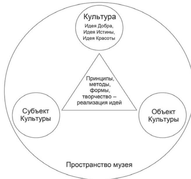
Модель как обобщенный мысленный образ образовательного процесса в пространстве музея

зовательного процесса в музейной среде. Цель, задачи, содержание, учебно-тематический план, формы и методы обучения музейно-педагогической программы «Диалог культур “Восток-Запад”» как комплексной педагогической модели «музей-школа» обусловлены вышеперечисленными принципами.